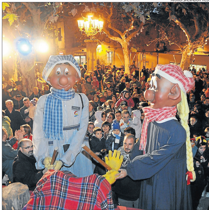
Els gegants de Sant Vicenç posant a prova el tió, l'any passat

El tió, però, no es podrà picar fins que estigui ben escalfat, i per això hi ha tot un seguit d'actes