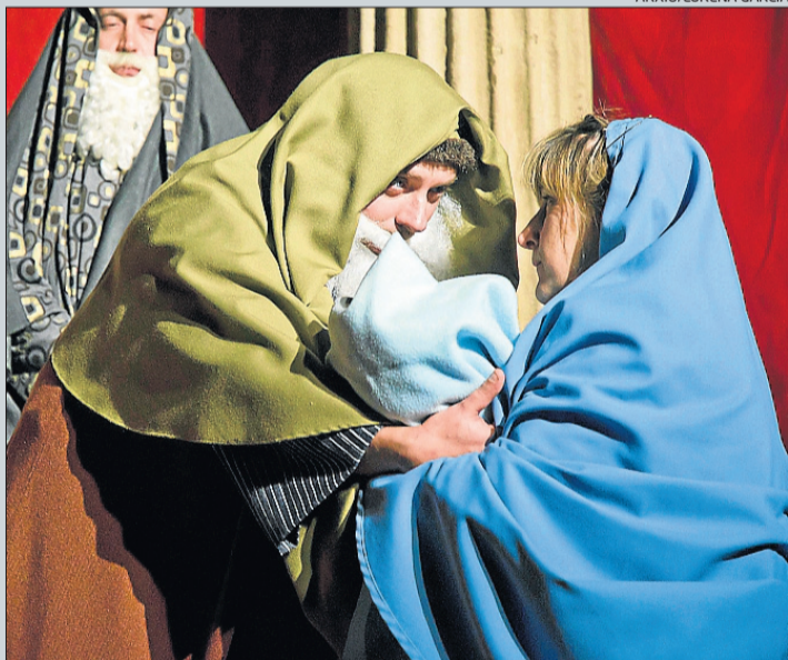
Josep i Maria al pessebre vivent dels Prats de Rei de l'any passat