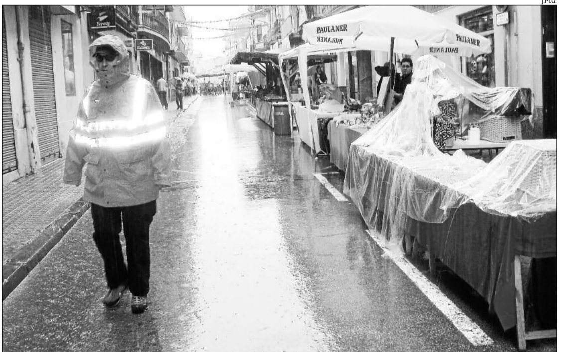
La pluja va fer buidar els carrers de gent i les parades havien de protegir els seus productes

Mentrestant, els jocs infantils que es van concentrar a la plaça Clavé eren buits, el mateix que l'escenari de l'espai Ateneu, situat on fins fa poc hi havia l'Ateneu de Sant Vicenç, i que havia d'acollir ac-