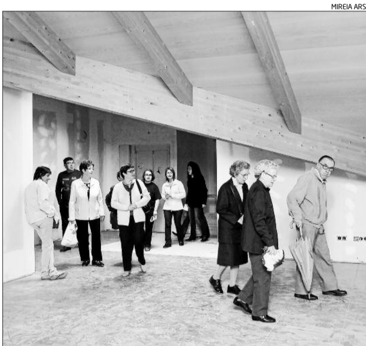
Visita a la sala que servirà de biblioteca per a la nova escola de música