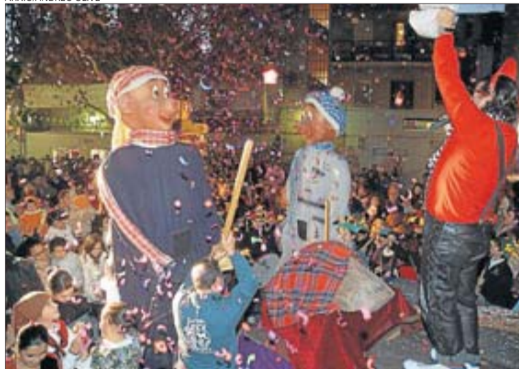
Els gegantons de Sant Vicenç són els encarregats de posar a prova el tió