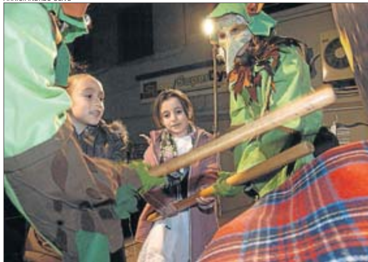
Els nens i les nenes piquen fort el tió amb l'ajuda dels tioners del bosc