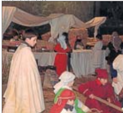
Imatge del pessebre de Solsona