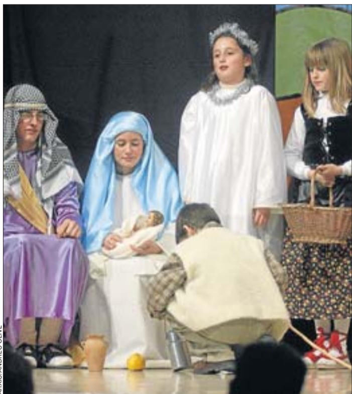
Representació dels Pastorets de Gósol en una imatge d'arxiu