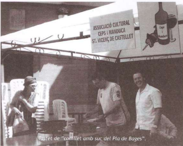
Tastet de "conillet amb suc del Pla de Bages".