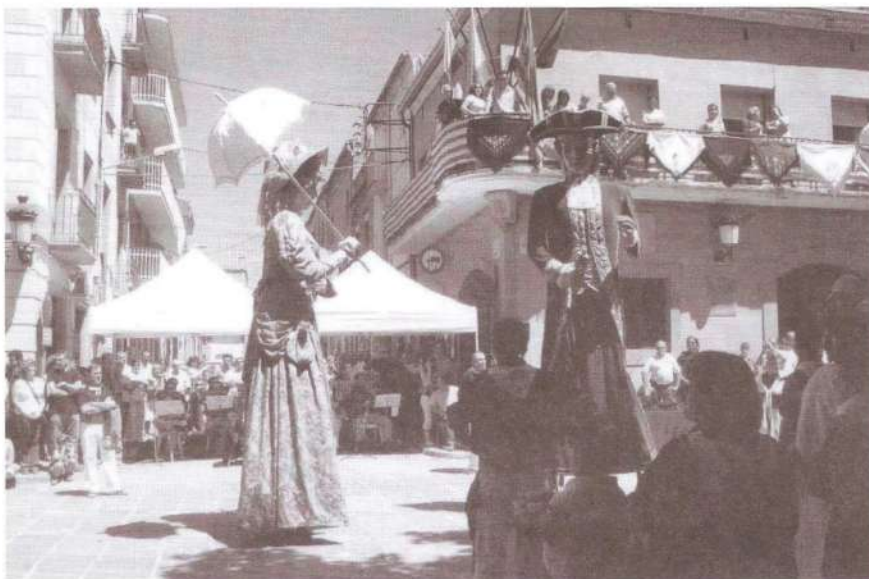
Els gegants ballant el seu tradicional Vals.

– Exposició "Arquitectura Religiosa Romànica de la Comarca