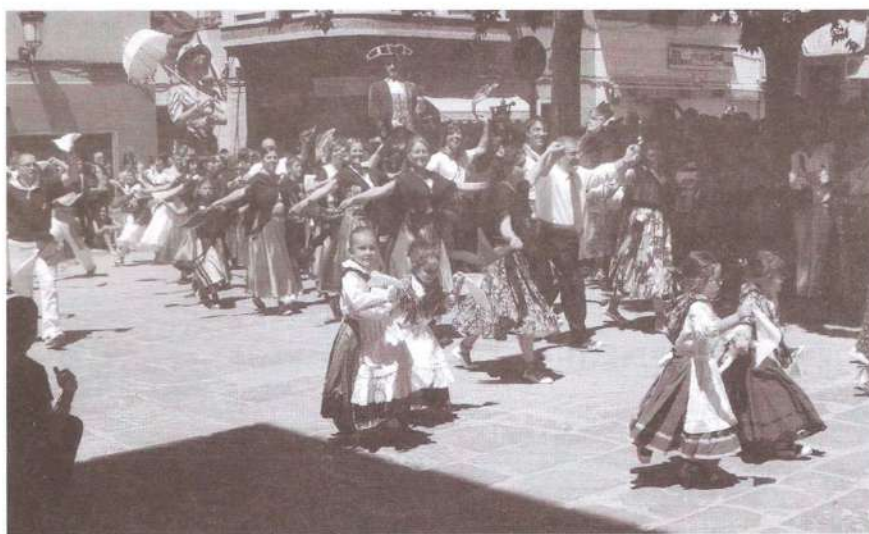
Moment del "galop", ball de cloenda del Ball de Gitanes Popular.