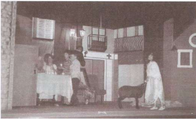
Teatre: L'últim tren de Sant Vicenç de Castellet.