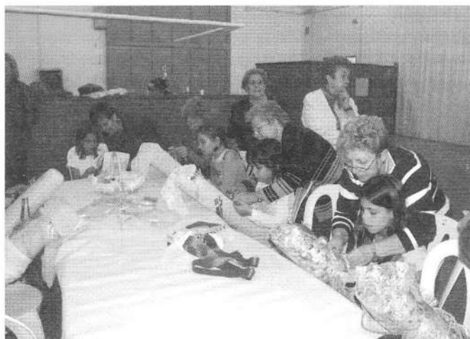
El taller de boixets va anar a càrrec de les puntaires del poble que van ensenyar a tothom qui volgués fer puntes de coixí.

El dijous va ser un dia ple d'activitats a Can Soler. Tot i que en un principi s'havia de fer a la plaça porxada de Can Soler es va optar per fer-ho a dintre de la sala, ja que