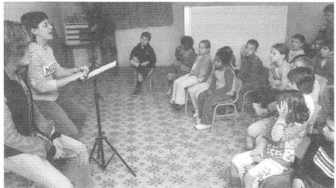
Els monitors de l'Associació Musical Castellet van ensenyar als més menuts dues cançons que aquella mateixa tarda la van cantar a davant dels pares.

Primerament es van cantar les cançons apreses. Llavors es van ballar les Gitanes i després hi hagué un correfoc infantil que va tenir molt bona resposta per part dels més petits de la casa.