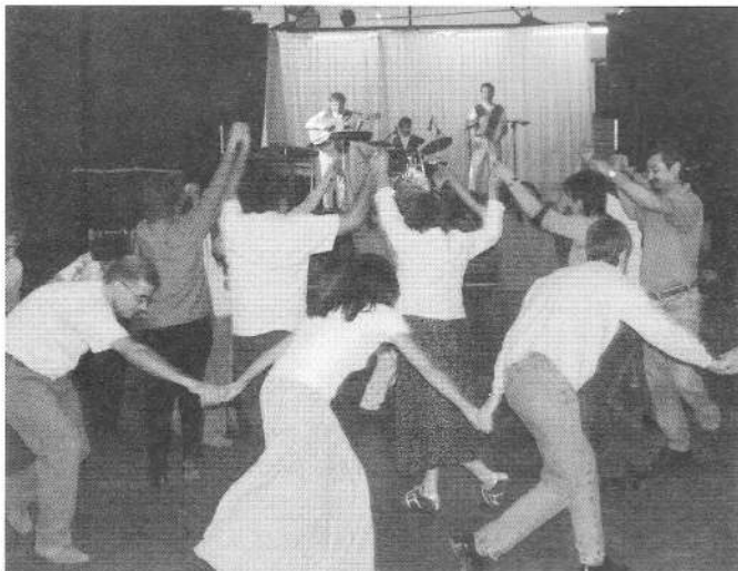
La sala de Can Soler es va omplir de balladors que ballaven al compàs de la música d'arreu del món de la companyia «Bufanúvols».

Aquest acte va anar a càrrec de la companyia «Bufanúvols», que va fer ballar de valent tots els assistents. Va ser un acte molt animat que va tenir una molt bona participació.