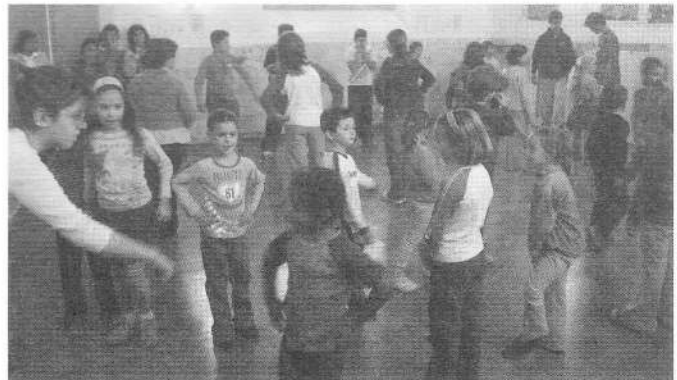
Els de l'Esbart Dansaire van ensenyar a ballar un fragment del ball típic santvicençí: el Ball de Gitanes.