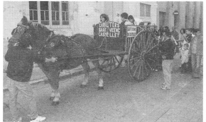
Les cues per pujar a dalt del carro del Gremi de CarreTERS i Cansaladers van ser habituals perquè tothom tenia ganes de pujar-hi.

Per acabar aquesta primera «Setmana de la Cultura» es va decidir fer una festa conjunta a la plaça Clavé. A partir de les set del vespre començava aquesta festa amb la intervenció de la Coral Al Vent i la Coral Nou Horitzó, que van interpretar dos temes cantats cada una. Llavors, es van projectar tota una sèrie de fotografies de totes les entitats participants que d'una manera o altra van participar a enriquir aquella setmana. Un cop vistes les fotografies, els diables de la Colla de Geganters van fer una extraordinari final de festa amb una mostra de correfoc que va omplir la plaça de llum, color, foc i so que va fer les delícies de grans i petits. Per acabar, un petit aperitiu va posar el punt i final aquesta primera experiència cultural santvicentina.