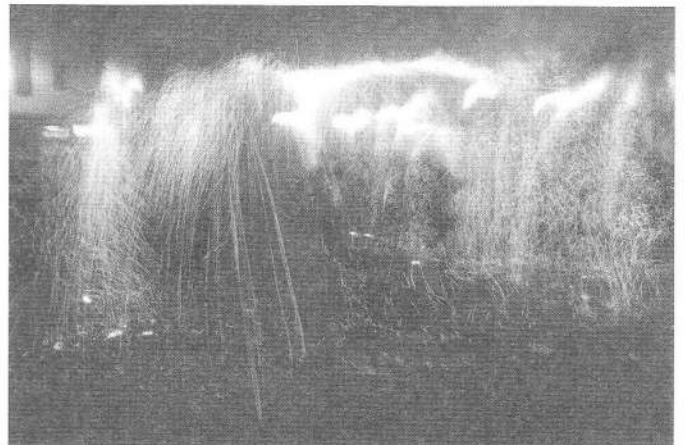
Els diables de la Colla de Geganters van fer un extraordinari final de festa amb una espectacular mostra de correfoc plena de llum, foc, color i so.