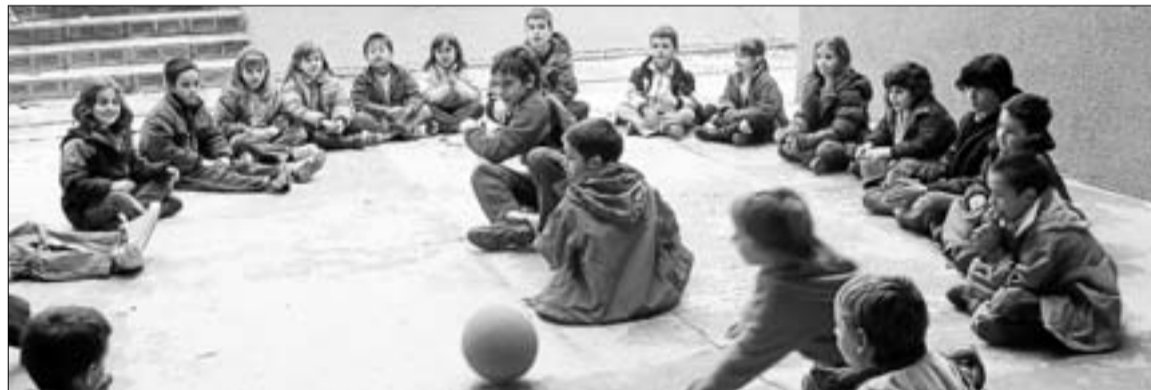
El matí de la diada es va dedicar a jugar als més d'onze jocs que s'havien preparat durant la setmana