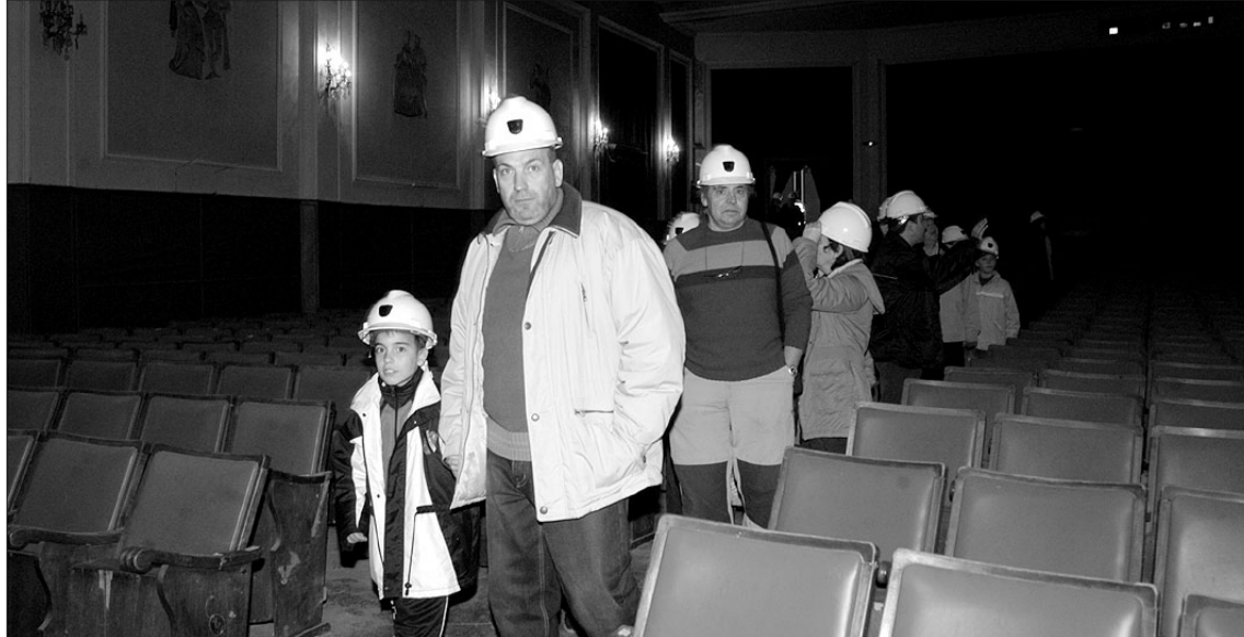
Els visitants van haver de posar-se cascos de seguretat a causa de les patologies constructives de l'edifici

Pavelló Municipal van estar retirades de l'edifici per poder rodar el projecte. Un projecte, que havia de presentar-se per Sant Sebastià -la festa major cultural del poble, el 20 de gener- però que s'endarrerirà fins a finals de febrer, principis de març. Segons