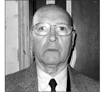
López va ser un dels guies