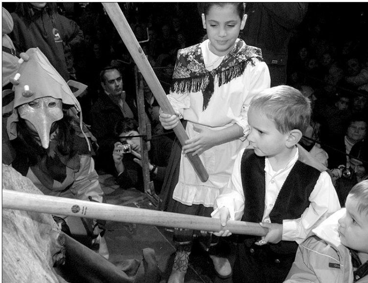
Després de la tradicional cançó i picar, el tió de Sant Vicenç regala dolços