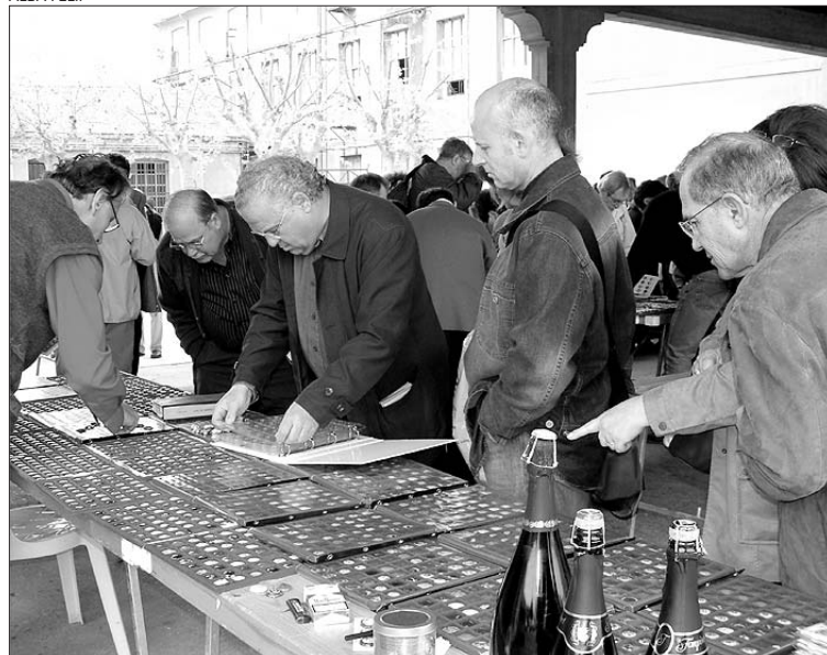
La 3a trobada de col·leccionistes de plaques de cava va ser tot un èxit