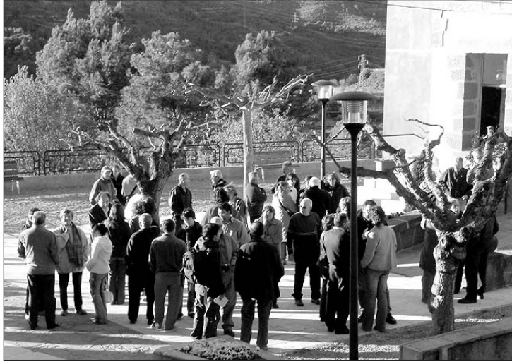
Darrera concentració contra l'abocador a Rellinars, dissabte passat